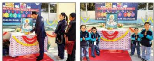
माँ सरस्वती को पुष्प अर्पित करते हुए।